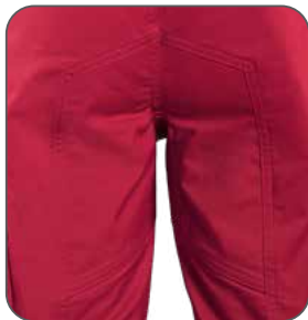
zesílený sed zosilnený sed reinforced seat wzmocnienie w kroku