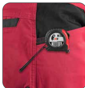
kapsa s vyztužením pro zavěšení metru vrecko s výstužou na zavesenie metra pocket with reinforcement for hanging a measuring tape kieszeń z wzmocnieniem do zawieszenia miarki