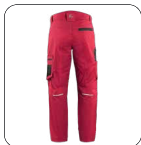
zadní strana zadná strana back side z tyłu